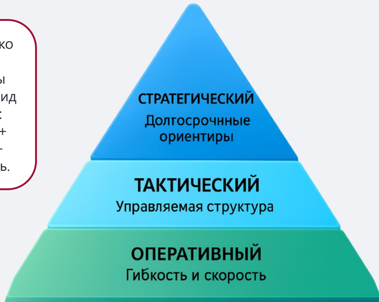
Уровни гибридной методологии

Сегодня проекты редко бывают «чистыми» всегда есть элементы классики и Agile. Гибрид объединяет лучшее: долгосрочные цели + быстрые итерации + прозрачный контроль.